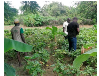
Aubergines en bananen op één perceel

Op de boerderij wordt onder meer geëxperimenteerd met het telen van een combinatie van gewassen op hetzelfde perceel. Zo worden op een veld met aubergines ook bananen geplant. Een nieuwe aanwinst zijn de zelf gemaakte bijenkorven. Bijen helpen bij de bevruchting van de fruitbomen, zoals de aangeplante bananen- en citrusbomen.