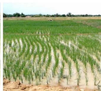
Rijstverbouw in afwachting van de start van de tuinbouw in november