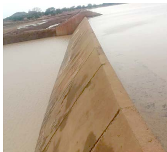
Aanleg van de barrage met dam

Voor en na de bouw van de nieuwe barrage met dam in omgeving Méguet: