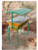
Bijenkorf bij Ferme pilote

De proefboerderij in Fidma ontwikkelt zich goed. Ook voor dit project is er belangstelling vanuit de Burkinese overheid. Begin juni zijn technici van het Ministerie van Onderwijs op bezoek geweest. De boerderij is nu erkend als opleidingsplek voor het opleiden van jonge mensen in de bos- en landbouw. De overheid helpt bij het werven van docenten. De komende tijd kunnen 30 jongeren met de opleiding starten.