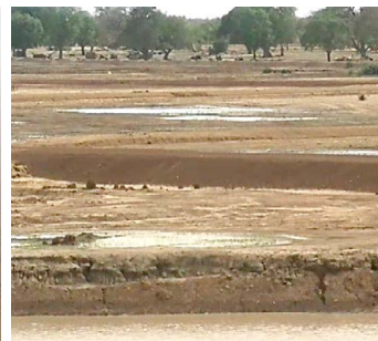
Prepareren van land voor tuin- of rijstbouw